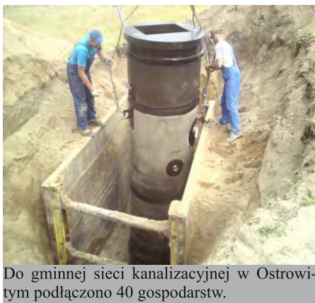
Do gminnej sieci kanalizacyjnej w Ostrowi- tym podłączono 40 gospodarstw.

Firma Eko-Instal ze Studzienic położyła sieć kanalizacyjną w miejscowościach Ostrowite i Prądzona kładąc w nich blisko 15 km rur. W pierwszej z tych miejscowości podłączono 40 gospodarstw, w drugiej zaś ok. 35. Obecnie przygotowywana jest doku-