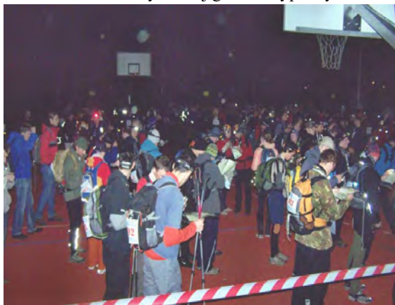
W zorganizowanym w Lipnicy Harpaganie wzięło udział blisko 900 osób.

ni. Wielu z nich jednak zapewniało, że w najbliższym czasie znów do nas powrócą, tym razem w ramach wycieczki.