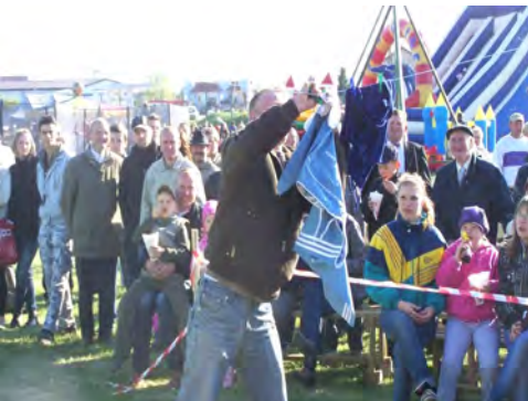
Uczestnicy festynu w Lipnicy zmagali się w licz- nych konkursach, m.in. w wieszaniu prania na czas.

śniewski padł”, którego pre- miera odbyła się w lutym tego roku, przypomina o tragicz- nych wydarzeniach z grudnia 1970 r.