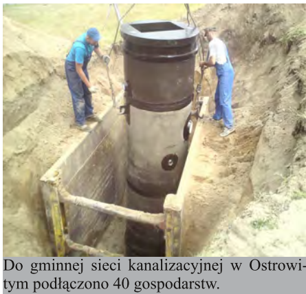
Do gminnej sieci kanalizacyjnej w Ostrowi- tym podłączono 40 gospodarstw.

Firma Eko-Instal ze Studzienic położyła sieć kanalizacyjną w miejscowościach Ostrowite i Prądzona kładąc w nich blisko 15 km rur. W pierwszej z tych miejscowości podłączono 40 gospodarstw, w drugiej zaś ok. 35. Obecnie przygotowywana jest doku-