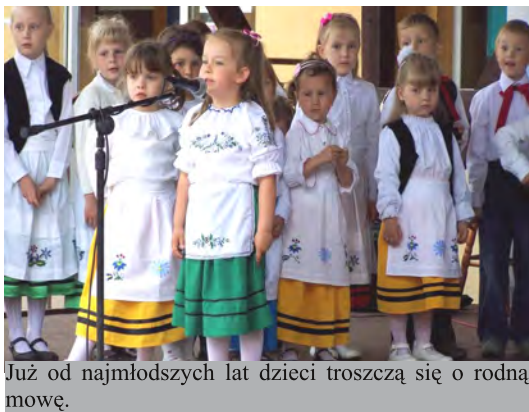
Już od najmłodszych lat dzieci troszczą się o rodną mowę.

W niedzielę 29.05. w Brzeźnie Szlacheckim już po raz XIX odbył się Gminny Przegląd Twórczości Kaszubskiej. Zorganizowano go pod hasłem „Je ju wioldzi czas abë zóden Kaszëba sã nie wstydżël pò kaszëbskù gadac”. Poza kaszubskimi