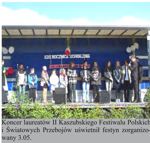
Koncert laureatów II Kaszubskiego Festiwalu Polskich i Światowych Przebojów uświetnił festyn zorganizowany 3.05.

Już po raz drugi Zespół Szkół w Lipnicy przy współudziale lipnickiego oddziału Zrzeszenia Kaszubsko-Pomorskiego i Urzędu Gminy zorganizował Ka-