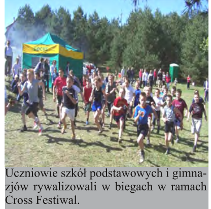
Uczniowie szkół podstawowych i gimnazjów rywalizowali w biegach w ramach Cross Festiwal.

Organizatorami biegów byli Urząd Gminy oraz Uczniowski Klub Sportowy „TROPS” z Lipnicy. Impreza odbyła się w ramach Cross Festiwal.