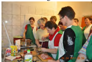
W kursie gotowania zorganizowanym w Brzeźnie Szlacheckim wzięło udział 20 pań.