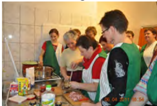
W kursie gotowania zorganizowanym w Brzeźnie Szlacheckim wzięło udział 20 pań.