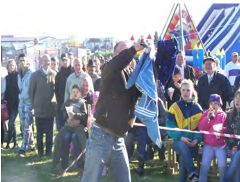
Uczestnicy festynu w Lipnicy zmagali się w licznych konkursach, m.in. w wieszaniu prania na czas.

Na zakończenie festynu zagrał zespół Fucus, który w swoim repertuarze ma także kaszubskie piosenki.