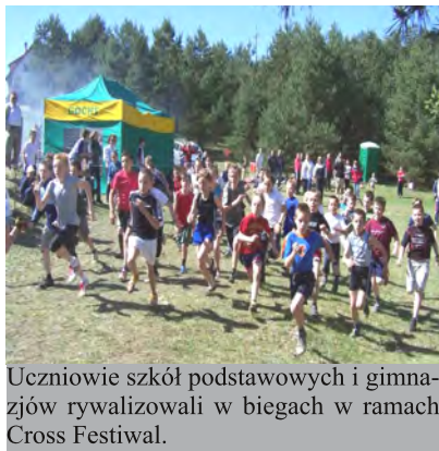
Uczniowie szkół podstawowych i gimnazjów rywalizowali w biegach w ramach Cross Festiwal.

Organizatorami biegów byli Urząd Gminy oraz Uczniowski Klub Sportowy „TROPS” z Lipnicy. Impreza odbyła się w ramach Cross Festiwal.